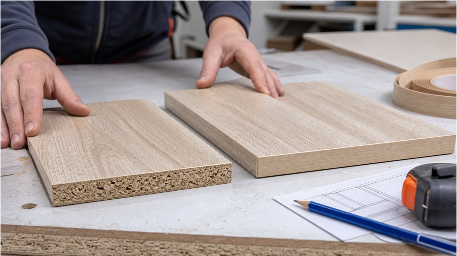
Grafika poglądowa: surowa krawędź płyty kontra estetycznie wykończony element.

Formatki masz, dekor wybrany. Zostaje detal, który robi ogromną różnicę: obrzeże. To ono decyduje, czy półka wygląda jak gotowy element, czy jak surowa płyta z garażu.