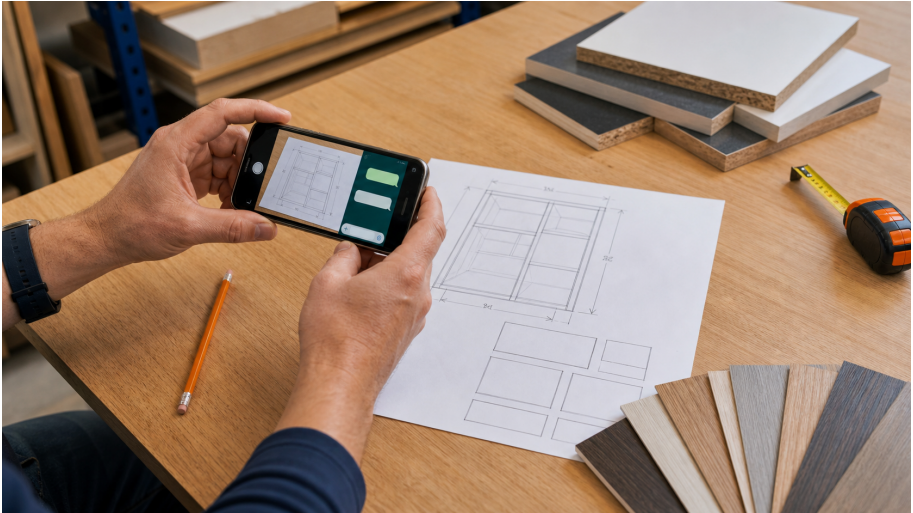
Cover: szkic, telefon i próbki dekorów przed wysłaniem zapytania.

Masz pomysł na półkę, szafkę albo blat, ale nie wiesz, co napisać do wyceny? Spokojnie. Nie potrzebujesz programu ani projektu od stolarza. Wystarczy kilka konkretnych informacji.