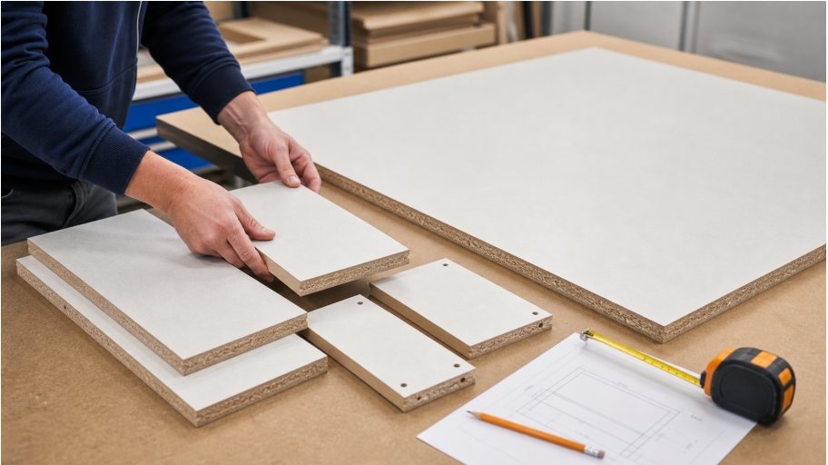
Cover: arkusz płyty i gotowe formatki przygotowane do zamówienia.

Pierwszy raz zamawiasz cięcie? Spoko. Wystarczy ogarnąć jedno słowo, które będzie się przewijać wszędzie: formatka.